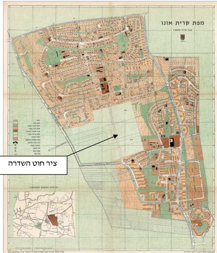
(1964) מפת הישוב. ניתן להבחין בציר "חוט השדרה" המחבר בין קיראון לשכונה הוותיקה, א.מ.ק"א (1964) Town map The "spinal cord" route connecting Kiron and the old neighborhood is discernible

לתכנון... לכן יש מיד לתכנן חוט שדרה למקום ויש לאתר בו את המרכז. יש לדאוג בעיקר לקשר האורגני של כל השיכונים והפיתוחים השונים אל מרכז זה ואת הקשר שלו למערכת התנועה הארצית. רק כך אפשר להפיח חיים במקום ולתת לו לב 6 .