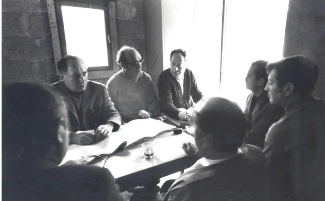
דיון בוועדה הארכיטקטונית Meeting at the Architectural Committee